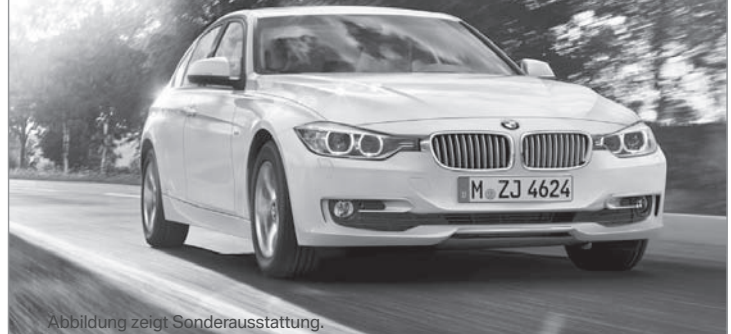
Abbildung zeigt Sonderausstattung.