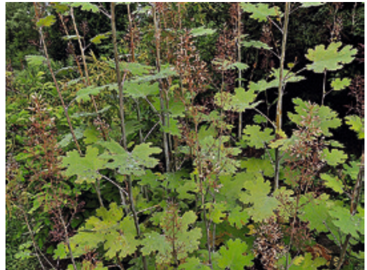
Abb. 2: Federmohn, Macleaya cordata

untergliedert sind. Mittlerweile gibt es auch eine ganze Reihe von Zuchtformen.