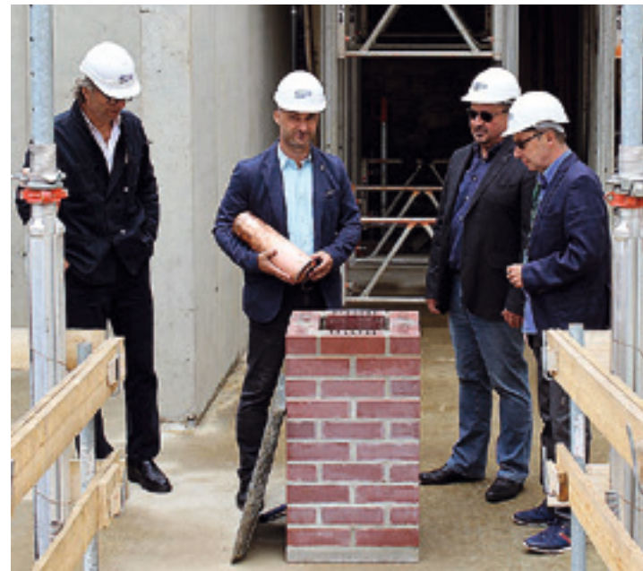
Bürgermeister Rico Schmidt präsentiert die Zeitkapsel.

hin akribisch an der Arbeit, weitere Fördermittel und Spenden für den Bau zu gewinnen. Auch der Förderverein Perlmuttermuseum e.V. freut sich über weitere Unterstützung und Mitglieder. Alle wichtigen Informationen zum Verein und Thema Spenden erhalten Sie direkt im Museum oder auf www.perlmuttermuseum.de Der Bau des ErlebnisZentrumPerlmutter wird durch das Bundesprogramm Nationale Projekte des Städtebaus des Bundesministeriums für Wohnen, Stadtentwicklung und Bauwesen gefördert. Stadtverwaltung u. Museum Adorf