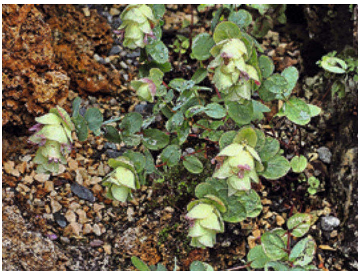
Abb. 1: Rundblättriger Dost, Origanum rotundifolium

Origanum rotundifolium (Abb. 1). Der recht kleine Halbstrauch, der auch manchmal als Hopfendost oder Hopfenoregano bezeichnet wird, hat seine Heimat in der nordöstlichen Türkei bis zum Kleinen Kaukasus in Georgien. Er wächst dort auf felsigem Untergrund und wird bis 30cm hoch. Die Art liebt einen Standort in voller Sonne auf gut drainiertem Untergrund. Die Frosthärte ist nicht besonders hoch; dem sollte bei der Kultur Rechnung getragen werden. Die auffälligen Blütenstände bestehen aus kleinen blaus violetten Einzelblüten, die von großen blaugrünen Tragblättern umgeben sind. Die Gattung gehört zur Familie der Lippenblütengewächse und umfasst etwa 45 Arten, die in verschiedene Gruppen