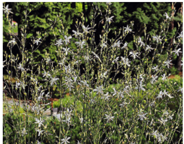
Abb. 3: Astlose Graslilie, Anthericum liliago

Text und Bild Dr. Peter Renner, Botanischer Garten Adorf