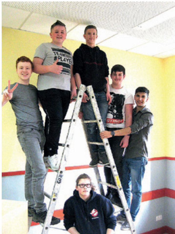
die Klasse 9b der Zentralschule Adorf

niert werden. Einig wurde sich die 9b schnell in der Farbgestaltung. Allerdings wird noch nicht zu viel verraten, denn das Projekt läuft momentan auf Hochtouren. Wir freuen uns, bald weiter berichten zu können. Seien Sie gespannt!