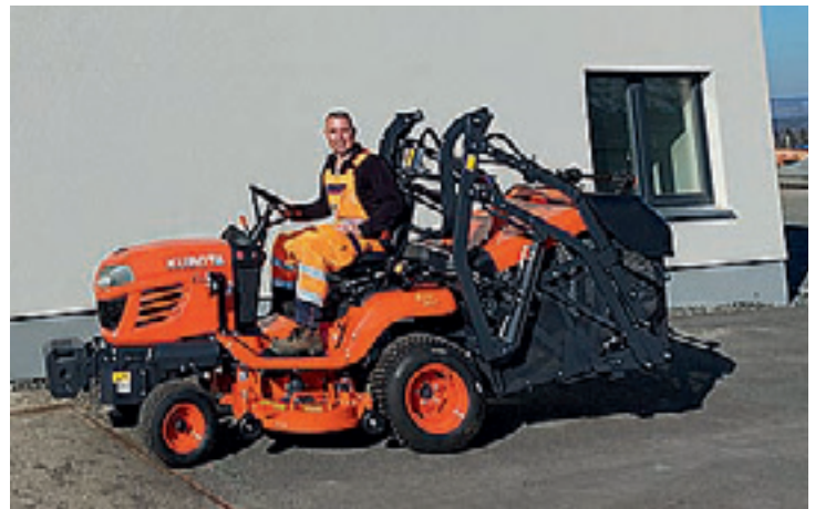
Seit Anfang März ist der Stadtbauhof in Besitz eines Kubota Rasentraktors G 23.