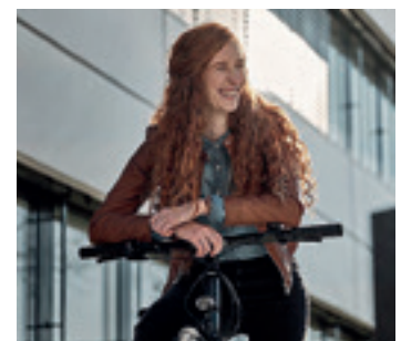
Paracelsus-Mitarbeiterinnen und -Mitarbeiter können jetzt aufsatteln.