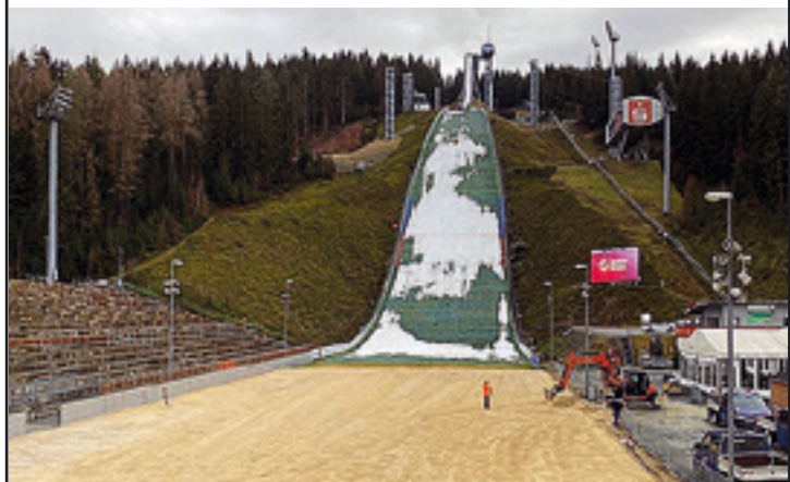
Der Schanzenauslauf der Klingenthaler Vogtland-Arena wird derzeit durch Mitarbeiter der VSTR Rodewisch AG zum Eisstadion umgebaut. 400 Tonnen Sand bilden die Grundlage für die Eisfläche.